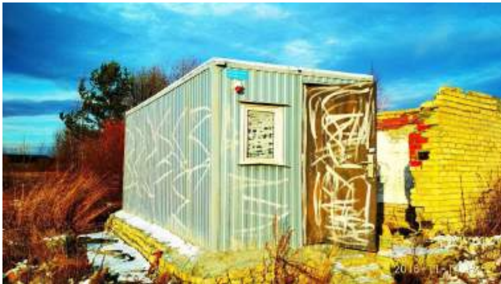
Рисунок 2. Здание над скважиной "Земледелец"