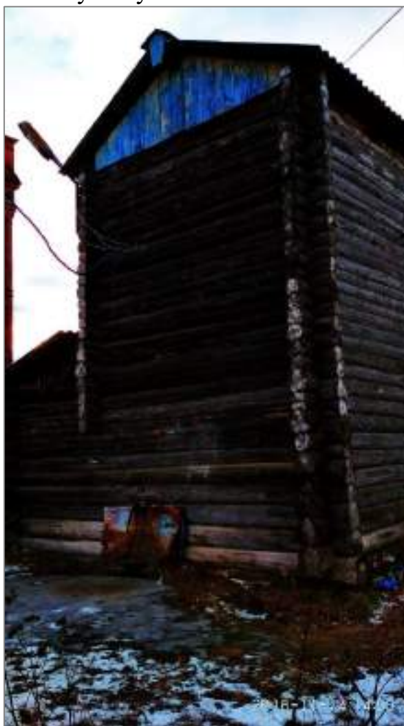
Рисунок 4. Водонапорная башня-сруб

б) Визуально-измерительное обследование.