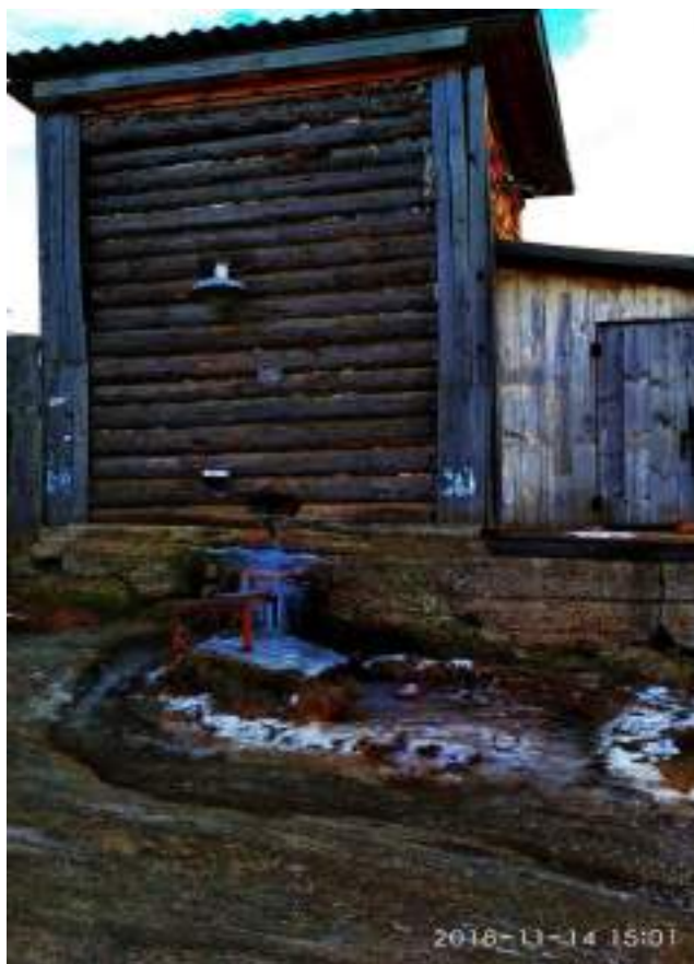
Рисунок 7. Здание-сруб над скважиной по ул. 25 лет Октября

На момент проведения технического обследования здание находится в удовлетворительном состоянии.