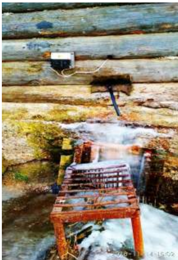
Рисунок 8. Прибор учета потребления электрической энергии скважины по ул. Пионерская, 54