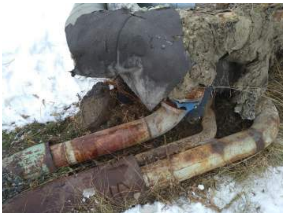
Рисунок 9. Участок трубопровода системы горячего водоснабжения

В ходе визуально-измерительного обследования установлено: