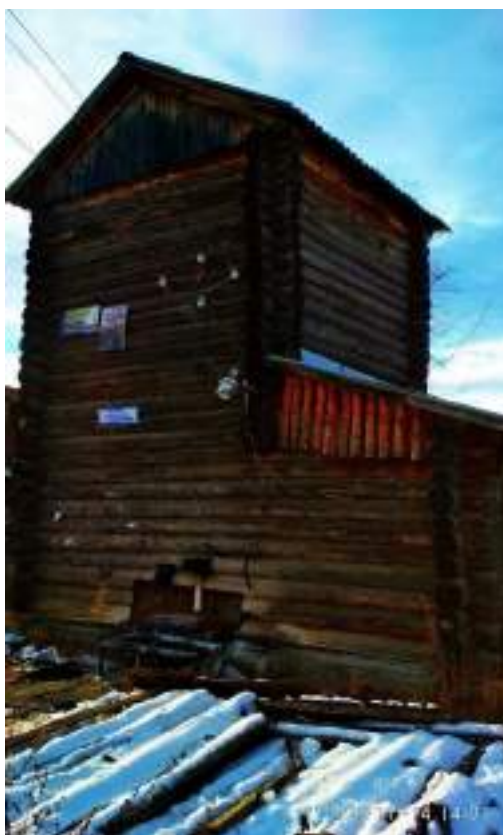
Рисунок 5. Здание-сруб скважины по ул. Пионерская, 54

На момент проведения технического обследования здание находится в удовлетворительном состоянии (Рисунок 5).