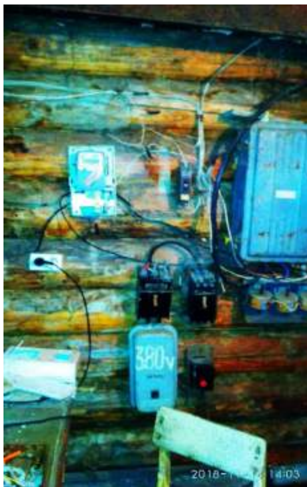
Рисунок 6. Прибор учета потребления электрической энергии скважины по ул. Пионерская, 54