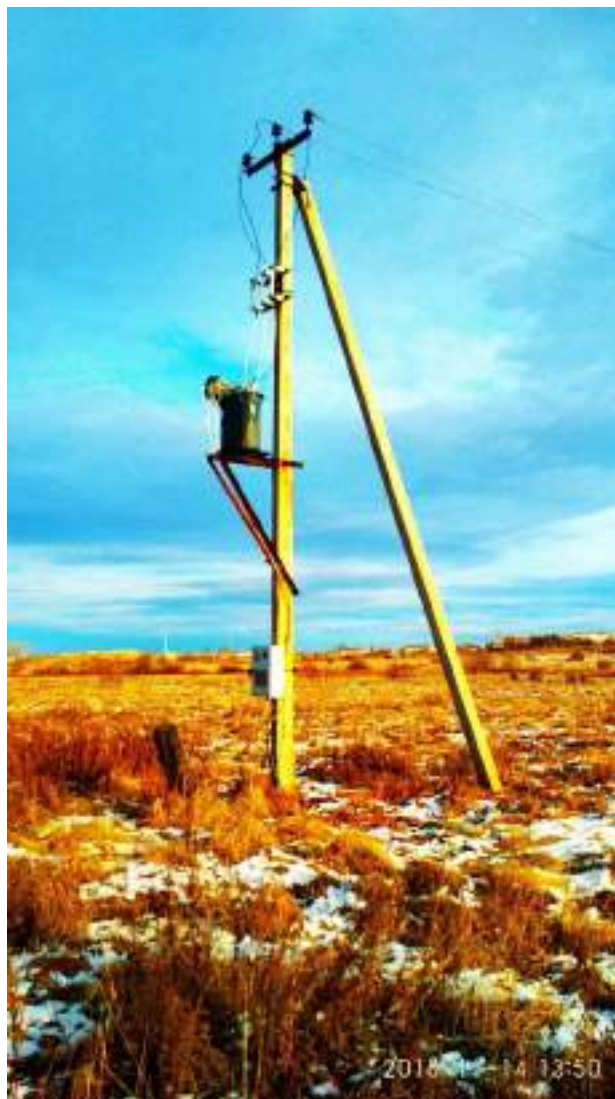
Рисунок 3. Прибор учета электрической энергии

В ходе визуально-измерительного обследования установлено: